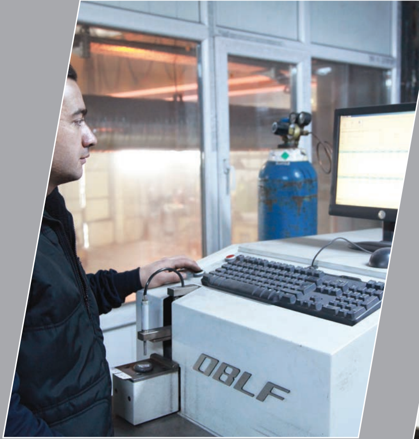
OBLF marka 18 element spektrometre