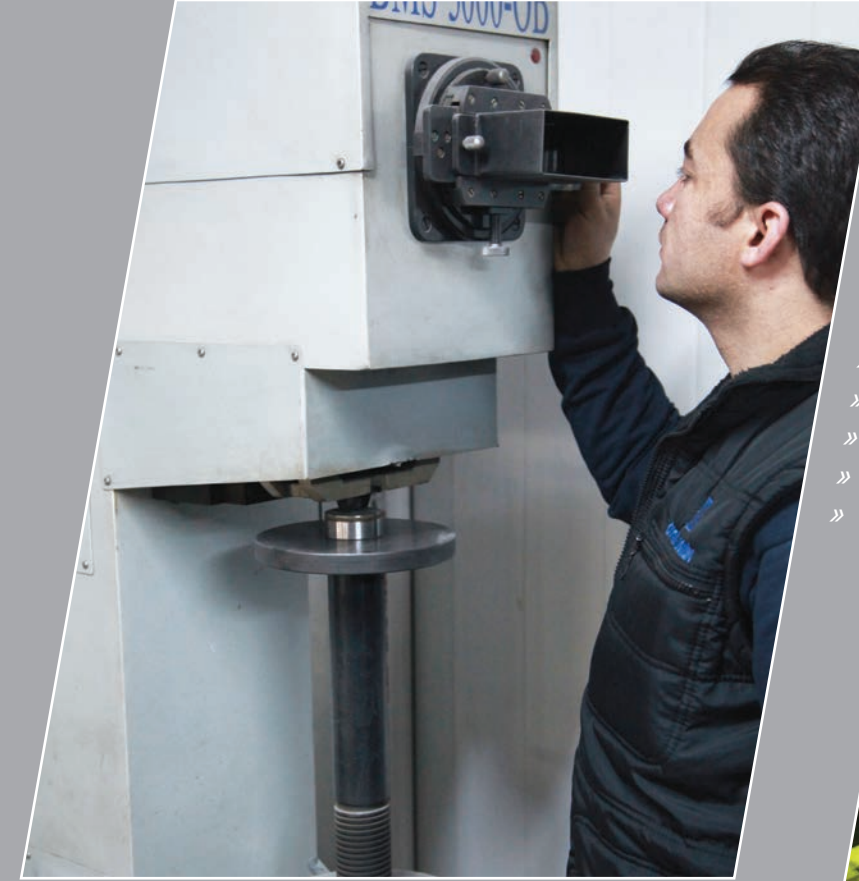
Sertlik Ölçme Cihazı