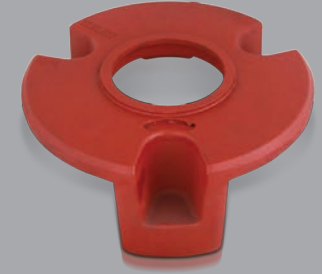
Manyetik Partikül Testi